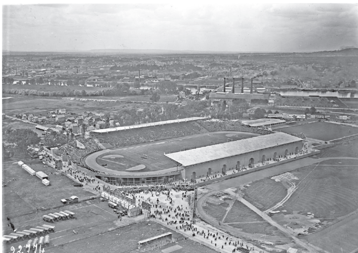
Site des Jeux olympiques 1924 et 2024: Stade olympique Yves-du-Manoir, Colombes.